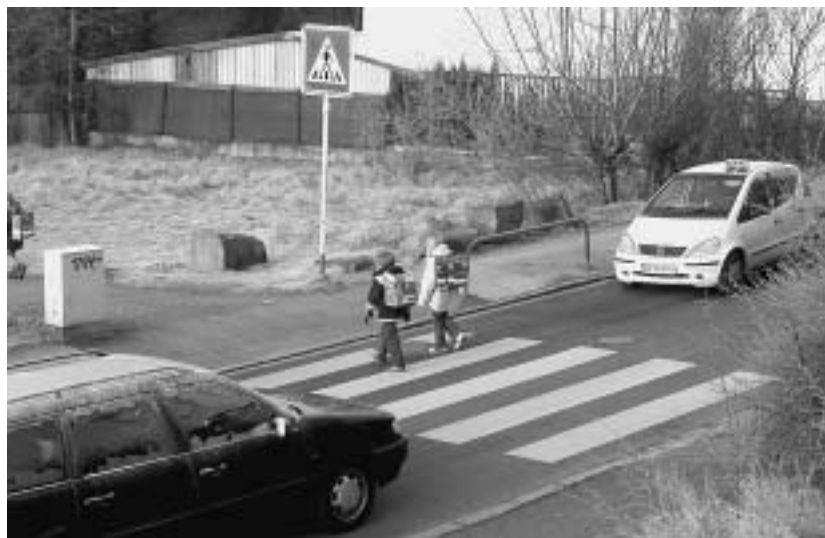
Der Zebrastreifen: Ein ‚unbedeutender‘ Verkehrsteilnehmer (etwa ein Kind) kann einen ‚viel bedeutenderen‘ Verkehrsteilnehmer (etwa einen Geschäftsmann) zum Abbremsen zwingen.

Aber es gab auch andere Fälle: Anwohner einer Dortmunder Sammelstraße forderten ab 1996 einen Zebrastreifen zwischen Wohngebieten, Schule und Kindergarten. Das Straßenverkehrsamt lehnte dies zunächst mit dem Argument ab, die Verkehrsbelastung auf der Straße sei zu gering, um einen Fußgängerüberweg gemäß Richtlinie zuzulassen. Diese Verkehrsbelastungsaussage fußte allerdings nicht auf aktuellen Zählraten. Aus diesem Grund empfahl der Verfasser der Grünen Ortsgruppe, eine eigene Verkehrszählung zu initiieren, die den Anforderungen der Stadt an derartige Zählungen entspricht. Das Ergebnis erstaunte alle Beteiligten: an einem Normalwerktag befuhren zwischen 15 und 19 Uhr 1.349 Kfz (umgerechnet 664 Kfz in der Spitzenstunde) den als wenig befahren eingeschätzten Straßenabschnitt. Somit wurde nicht der untere Grenzwert der R-FGÜ 84 unterschritten, sondern der obere Grenzwert! Es folgte eine Kurzauswer-