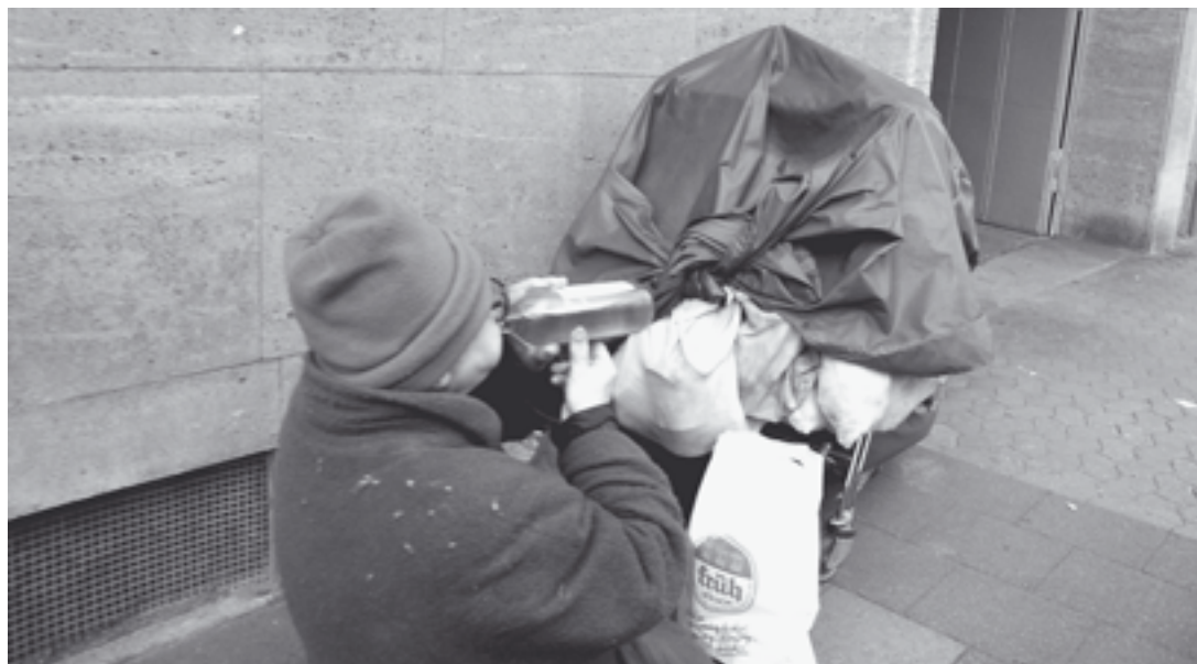
Gerade bei knappen Kassen ist eine Kommunalisierung der Drogen- und Suchtpolitik mehr als kontraproduktiv.

Gemeinsam werden wir Grüne uns aber in Land und Kommunen dafür engagieren müssen, dass das Geld, welches heute für die einzelnen Bereiche bereitgestellt wird, mindestens in vollem Umfang im System bleibt!