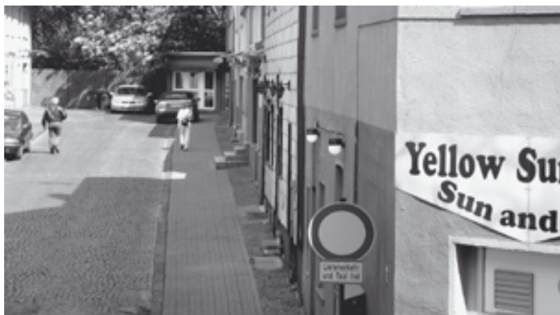
Toleranzzone in Bochum

Dass dies ohne Verfall der Sitten und des Anstands und auch ohne Gefährdung der Jugend möglich ist, beweisen Städte, die ohne Sperrgebietsverordnung auskommen, wie Berlin oder Mülheim an der Ruhr.