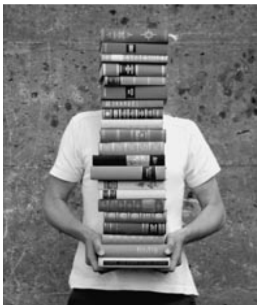
Der Unterricht in mehrsprachigen Klassen geht immer noch über die Köpfe vieler Kinder hinweg.