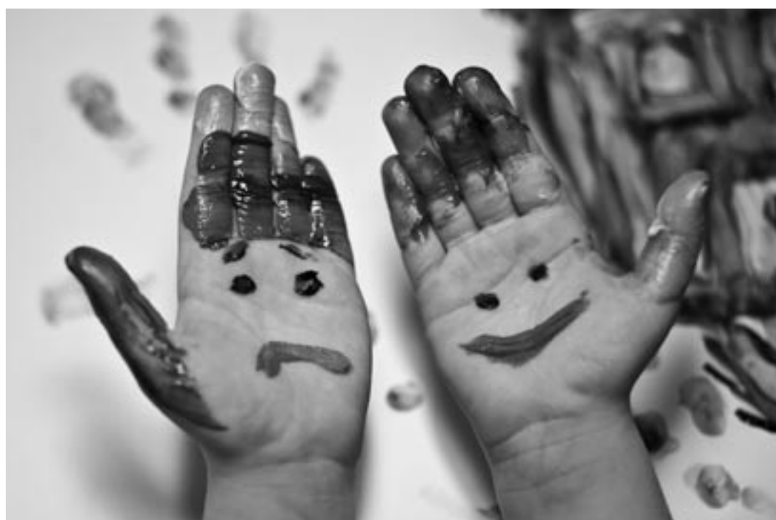
Ein gespaltenes Schulsystem und inklusive Bildung sind unvereinbar.