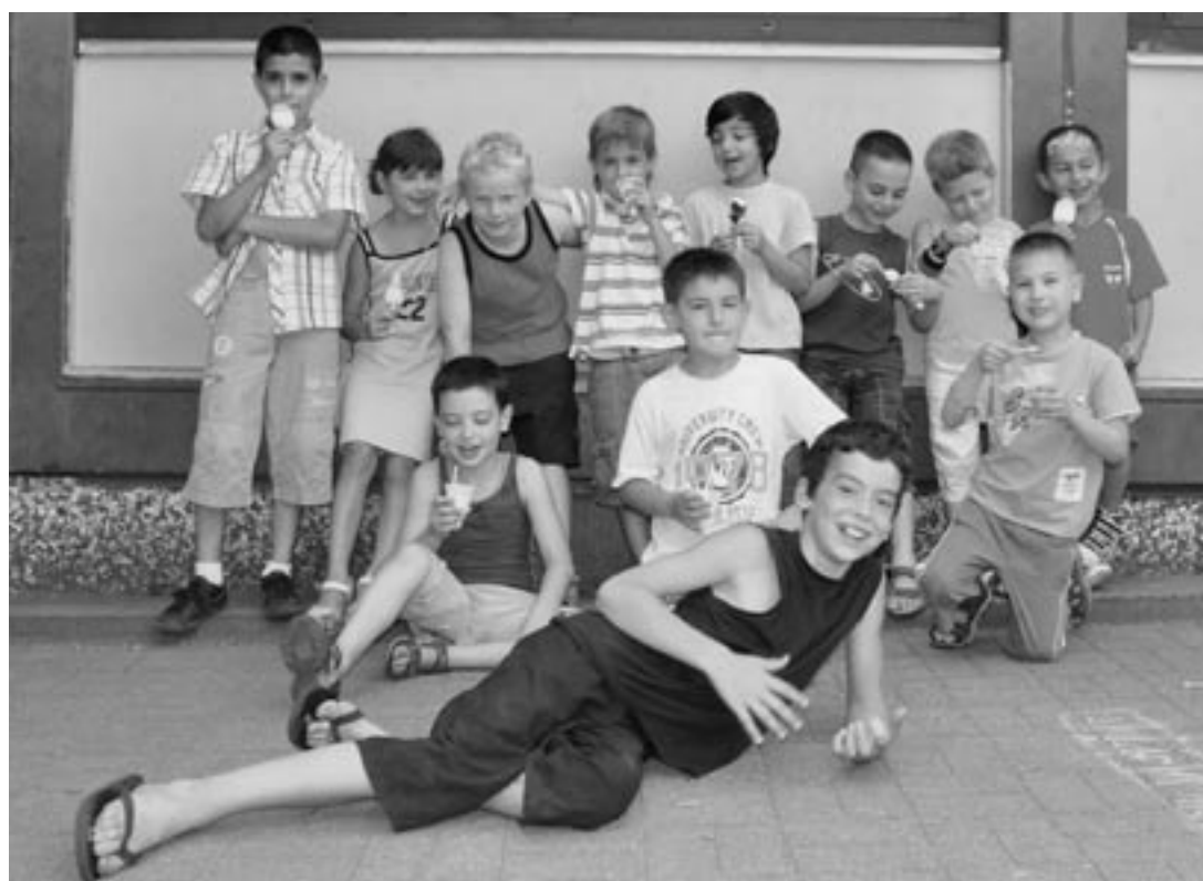
Wenn die Schule ein Ort gelebter Vielfalt ist, muss sich auch das Kollegium verändern.

Ohne real existierende Probleme in diesem Feld zu vernachlässigen, ist es möglich, aus einem vermeintlichen Defizit mit Namen „Migrationshintergrund“ das zu machen, was es schon immer war: nämlich eine Stärke!