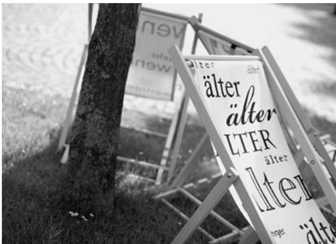
Das Projekt „Räume der Zukunft – Sichtwechsel im Liegestuhl“ eröffnet neue Perspektiven auf den Stadtteil