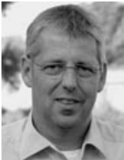
Günter Schabram (oben) Dezernent für Soziales und Gesundheit der StädteRegion Aachen