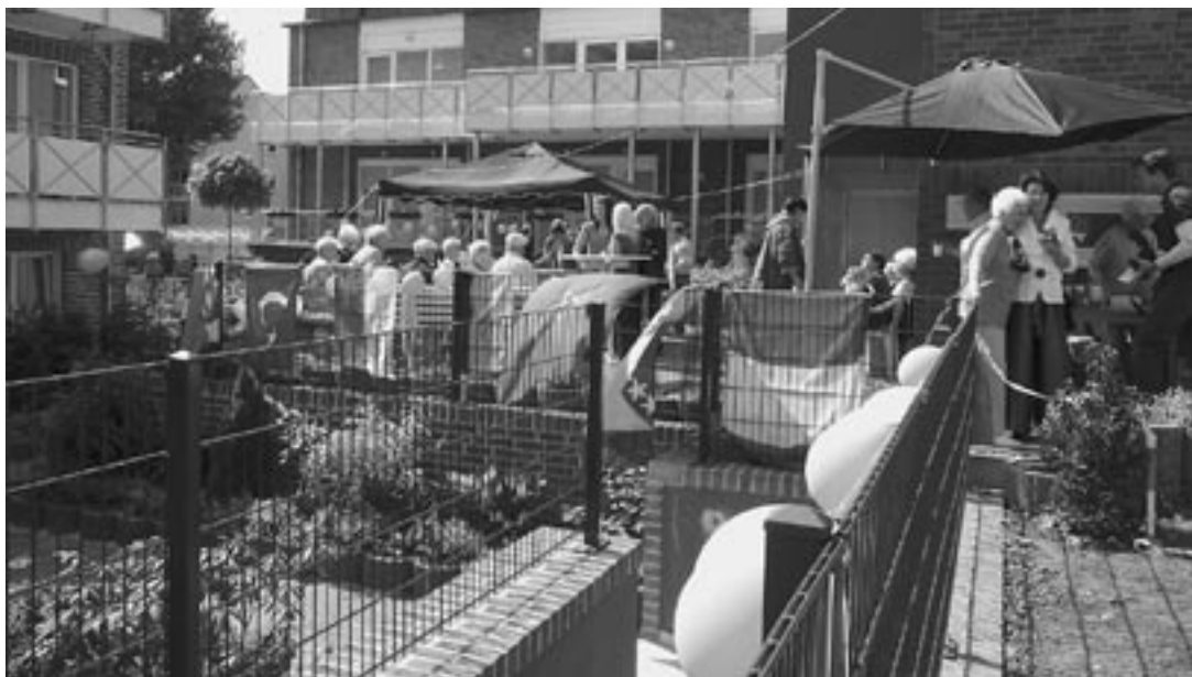
Fortführung des Gemeindelebens – Aktivitäten verbinden – ein Sommerfest der Familien, Alleinerziehenden, älteren Singles und Ehepaare (11 Nationalitäten) – Umbau und Erweiterung eines Gemeindehauses in Dortmund zu einem Mehrgenerationenwohnprojekt