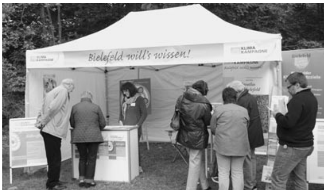
Die Klimakampagne Bielefeld will's wissen! wirbt für aktiven Klimaschutz als gesamtgesellschaftliche Aufgabe.

Diese Fragen gemeinsam zu erörtern und die Ergebnisse in das Energiekonzept der Stadtwerke einfließen zu lassen, ist die Aufgabe der nächsten Monate. Klar ist: BürgerInnenbeteiligung meint nicht nur, dass sich viele an dieser Diskussion beteiligen und möglicherweise abstimmen. Die Menschen in Bielefeld sind zugleich aufgerufen, auch ihren eigenen, konkreten Beitrag zu leisten.